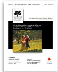
Watching the Apples SATB and TTBB