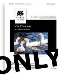
V'la l'bon vent SATB, SSAA