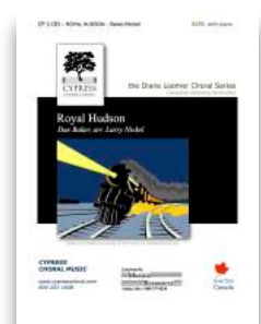
Royal Hudson SATB, SSAA, TTBB