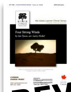
Four Strong Winds SATB, TTBB, SSAA