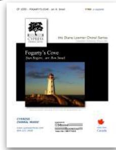
Fogarty's Cove SATB and TTBB