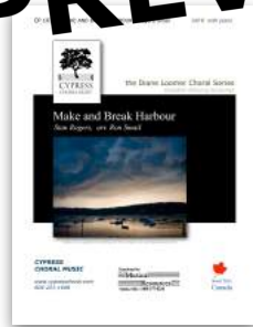
Make and Break Harbour SATB and TTBB