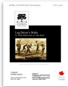
Log Drivers Waltz SSAA and SATB

other Canadian folk song winners in the Cypress Choral Music catalogue: