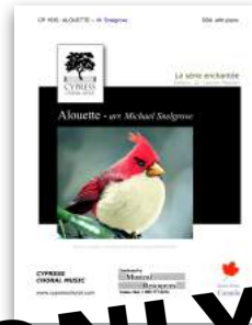
Alouette SATB and SSA